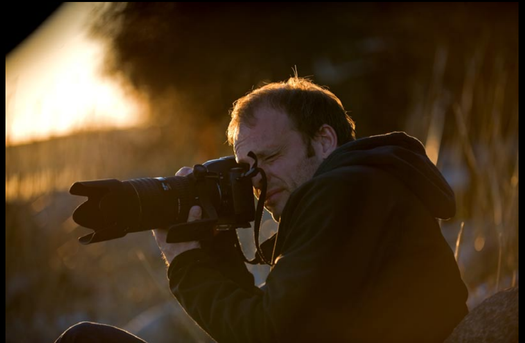
STEMNINGSBILLEDER FRA A.L.