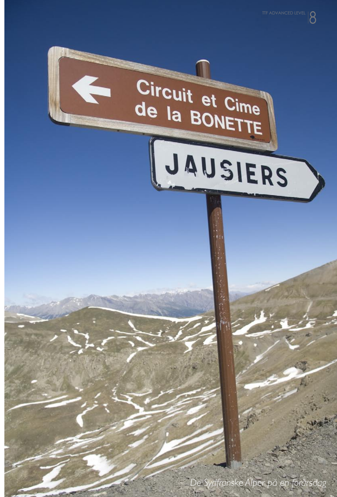
De Sydfranske Alper på en forårsdag

TTF (A.L.) certifikatet er din genvej til de helt store fotooplevelser.